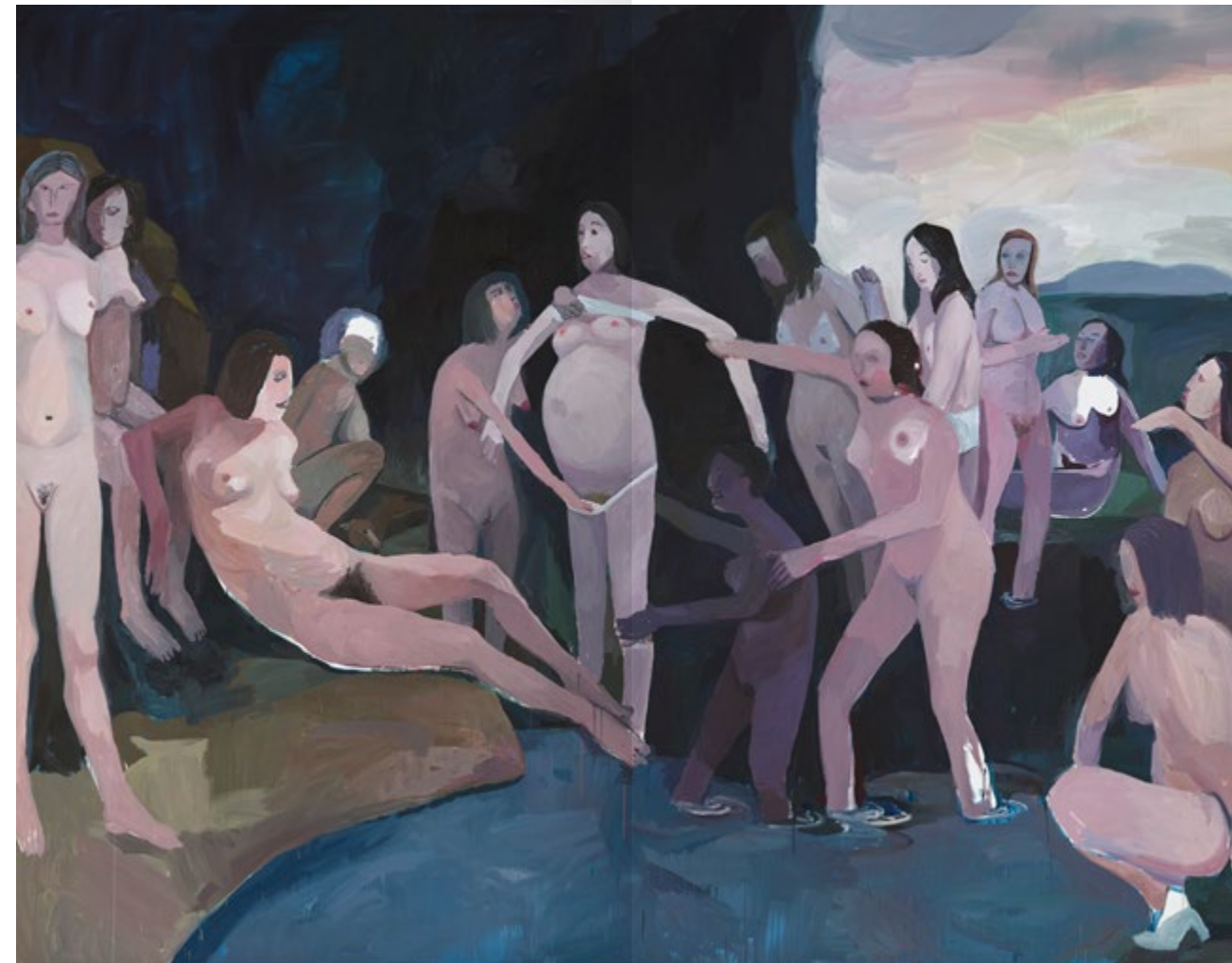
Helen Verhoeven, Diana Discovers the Pregnancy of Callisto , 2017 Acryl auf Leinwand, 280 x 360 cm, Courtesy die Künstlerin und Gregor Podnar © die Künstlerin, Foto: Peter Cox

Mischa Leinkauf und Matthias Wermke (2016), Viktoria Binschtok (2017), Frauke Dannert (2018), Agnes Meyer-Brandis (2019), Sung Tieu (coronabedingt auf 2021 verschoben) und Benjamin Houlihan (2022).